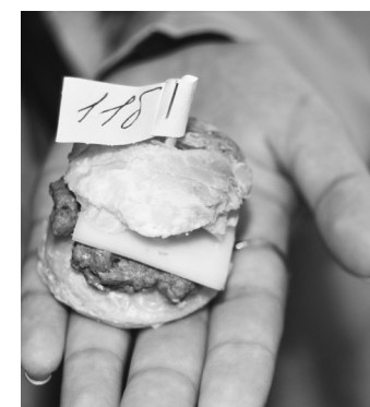
Разновидности предлагаемой продукции на ярмарке

наших военнослужащих почувствуют тепло и поддержку от нас.