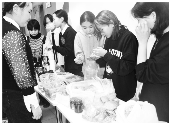
Учащиеся в роли продавцов